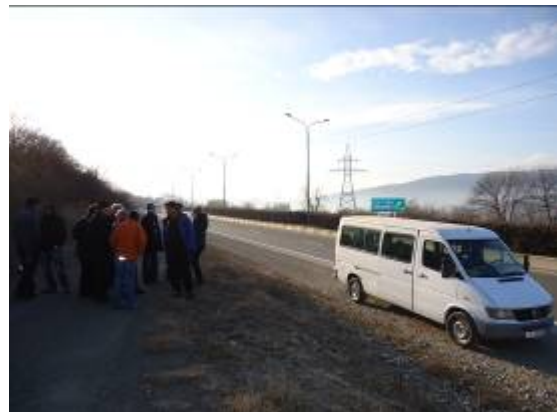
დაკვირვების პირველი წერტილი მარშრუტის დასაწყისში – წიწამურის მიდამოები

კერძოდ, მან აღნიშნა, რომ მდ. არაგვის მოპირდაპირე ნაპირზე ნათლად ჩანს მიოპლიოცენის კონგლომერატები, რომელსაც გეოლოგიურ ლიტერატურაში მოლასურ წყებას უწოდებენ. ეს წყება ფაქტობრივად წყალგაუმტარ კომპლექსს წარმოადგენს. კონგლომერატების გაშიშვლებიდან ჩრდილოეთით ნატახტრის