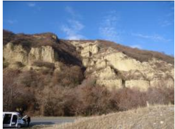
მოლასური ნალექების მძლავრი გაშიშვლება ბოდორნას წყალსაცავის მოპირდაპირე მხარეს

წყალსაცავი მოწყობილია მდ. არაგვის მარჯვენა სანაპიროზე ჟინვალის წყალსაცავიდან დაახლოებით 10 კმ-ის დაშორებით. მისი დანიშნულებაა ჟინვალის წყალსაცავიდან შემოსული ნაკადის რეგულირება წელიწადის დროების მიხედვით. აქედან წყალი თვითდინებით ღრმადელის წყალამდებს მიეწოდება 2-2.5 მ დიამეტრის ბეტონის მილებით. წყალსადენის მწარმოებლურობა 20 მ 3 /წმ-ს შეადგენს. ხსენებული წყალამდები თბილისის ზღვის ჩრდილოეთ პერიფერიაზე მდებარეობს, სადაც ხდება წყლის ფილტრაცია, კოაგულაცია, ქლორირება და ნაწილი (10 მ 3 /წმ) მიეწოდება თბილისის აღმოსავლეთ რაიონებს (ვარკეთილი, ვაზისუბანი, ისანი-სამგორი), დანარჩენი კი, თბილისის ზღვაში ჩაედინება.