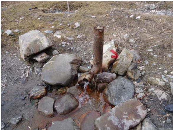
მინერალური წყაროს თვითდენადი ჭაბურღილი დაბა ფასანაურში

მინერალიზაცია საკმაოდ მაღალია – 6.5 გ/ლ, რაც გემოთიც ადვილი შესამჩნევია. ჰიდროკარბონატულ-ქლორიდული ნატრიუმისანი ქიმიური შედგენილობით ეს წყალი ესენტუკის ტიპის ცნობილი მინერალური წყლის ანალოგად შეიძლება ჩაითვალოს. მსგავსი შედგენილობის ბუნებრივი მინერალური წყლების გამოსავლები გუდამაყრის არაგვის ხეობაშიც ხშირად გვხვდება, რაც თვალწარმტაც პეიზაჟსა და ჯანსაღ მიკროკლიმატთან ერთად აქაც ტურიზმის განვითარების ყველა წინაპირობას შეიცავს.