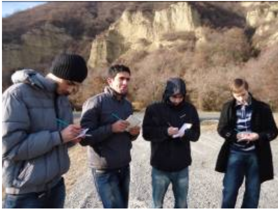
სტუდენტთა ჯგუფი იწერს პროფესორთა განმარტებებს