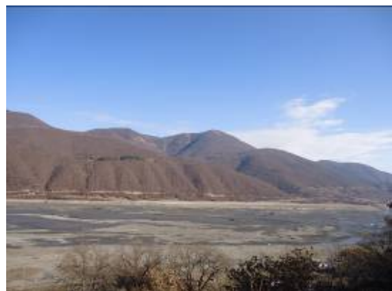
წყალსაცავის დამშრალი კალაპოტი ზამთრის წყალმცირობის პერიოდში

წყალსაცავის სიგრძე დაახლოებით 9 კმ-ია. მისი ჩრდილოეთი დაბოლოება ანანურის ისტორიული ციხე-სიმაგრის კედლებთან მდებარეობს. წყალსაცავი