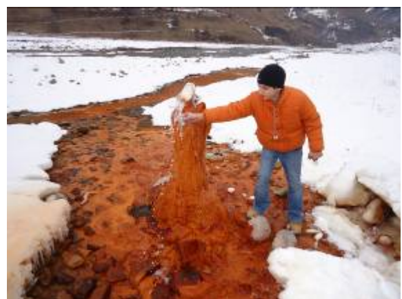
პატარა აკაკი მინერალური წყლით უმასპინძლდება სტუდენტებს და მასწავლებლებს

არსებული მონაცემებით, ჭაბურღილის სიღრმე 150 მეტრია, ხოლო წყალშემცველ ჰორიზონტს ქვედა ცარცის კარბონატული ფენაში წარმოადგენს.