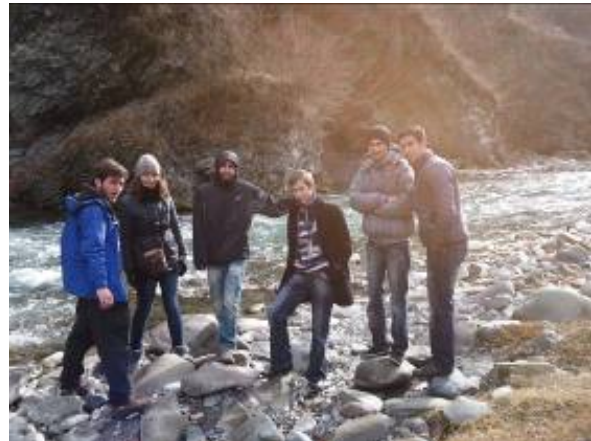
სტუდენტთა ჯგუფი მდ. არაგვის კალაპოტის ქვევზე

სოფ. ნადიბანის მიდამოებში სტუდენტებმა დაათვალიერეს და დააგემოვნეს ჭაბურღილიდან ამომავალი კიდევ ერთი ნახშირმჟავა-მინერალური წყალი (იხ. ფოტო).