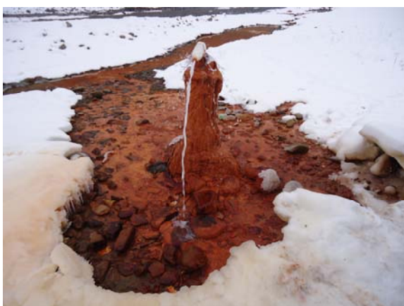
“ნადიბანთ-ვევა”. რკინის შემცველი მინერალური წყლის მკაფიო ნაკვალევი თოვლით დაფენილ მინდორზე

სოფ. ნადიბანის მიდამოებში სტუდენტებმა დაათვალიერეს და დააგემოვნეს ჭაბურღილიდან ამომავალი კიდევ ერთი ნახშირმჟავა-მინერალური წყალი (იხ. ფოტო).