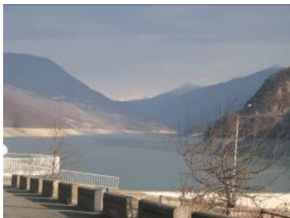
ჟინვალის უნიკალური წყალსაცავის საერთო ხედი

მარშრუტის ყველაზე უფრო საყურადღებო, კოლორიტულ და საინტერესო ობიექტს ჟინვალის ცნობილი წყალსაცავი წარმოადგენს, რომელიც მთიულეთის და ფშავ-ხევსურეთის არაგვის შესართავში არის მოწყობილი. 100 მეტრი სიმაღლის ჟინვალის წყალსაცავი კონსტრუქციულად მიწაყრილის ტიპისაა.