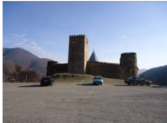
ისტორიული ექსკურსი ანანურის ციხესთან