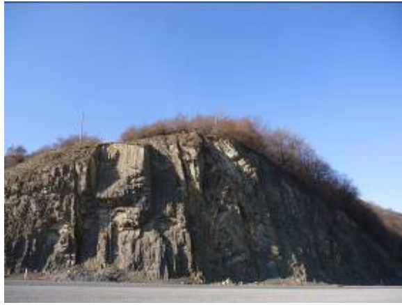
ცარცული ნალექების კლასიკური გაშიშვლება ანანურის ციხესთან

ზემოთ მოყვანილ ფოტოზე ჩანს ცარცის კარბონატული ფლიშური ნალექების (კირქვები, მერგელები და ქვიშაქვები, ზოგან კონგლომერატები) კლასიკური გაშიშვლება. ეს წყება ერთიან წყალშემცველ კომპლექსად განიხილება. ინტენსიური ტექტონიკური და ეგზოგენური დანაპრალიანების მიზეზით მაღალია ატმოსფერული ნალექების ინფილტრაციის სიდიდე, თუმცა, აღნიშნულ წყებაში წყალსიუხვით მხოლოდ კირქვები გამოირჩევა, რომლებისთვისაც დაკარსტულობის მაღალი მნიშვნელობა არის დამახასიათებელი. კარბონატული ქანების ინტენსიური დანაპრალიანება და დაკარსტულობა განაპირობებს მათ წყალსიუხვეს. მიწისქვეშა წყლები ცირკულირებს ნაპრალებში და კარსტულ სიცარიელებში.