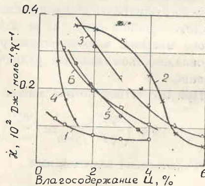
Рис. 2. Кривые зависимости \kappa = f(U) при температуре 275K. 1 — песчаник (плотность 3500 кг/м³); 2 — алевролит (2500); 3 — аргиллит (2470); 4 — сидеролит (2925); 5 — глинистый алевролит (2800); 6 — известковый песчаник (2900)

Результаты экспериментов по определению термоградиентного коэффициента сведены в таблицу. Кривые зависимости \delta = f(U) при T = 275K приведены на рис. 3.