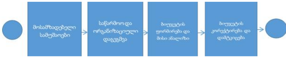
ნახ.3. საინვესტიციო ბიუჯეტირების ქვე-ბიზნეს-პროცესი