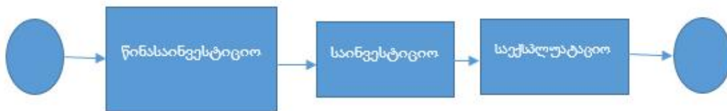
ნახ.1. საინვესტიციო საქმიანობის ზოგადი ბიზნეს-პროცესი

აღნიშნულის გათვალისწინებით ჩვენ მიერ აგებულია საინვესტიციო საქმიანობის ბიზნეს-პროცესი, რომელიც მოიცავს 3 ფაზას (ნახ.1).