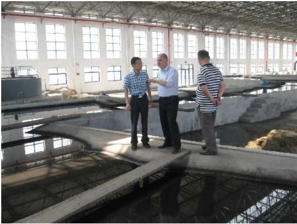
მდ. იანძის სამეცნიერო-კვლევით ინსტიტუტის ჰიდროტექნიკურ ლაბორატორიაში

Urban and Environmental Science College , CCNU