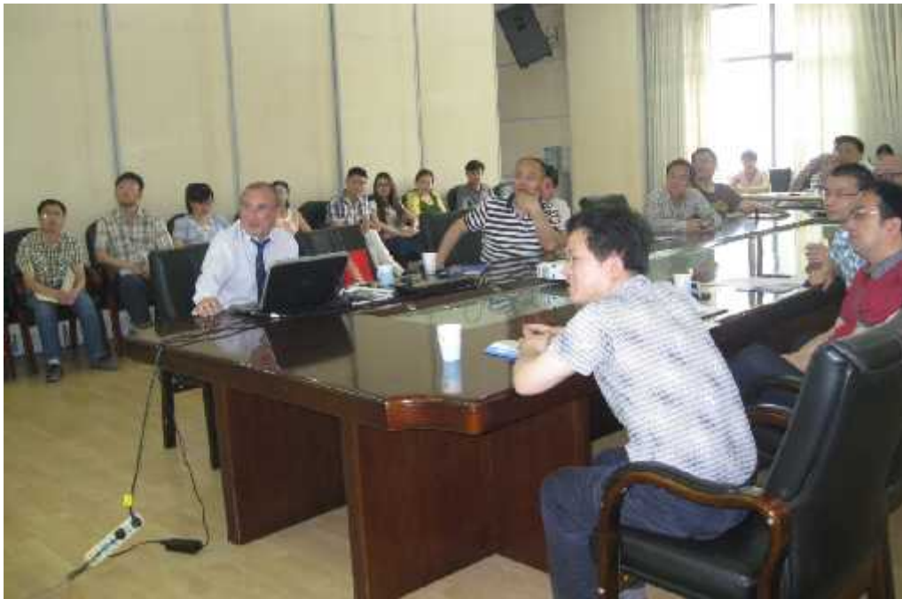
მდ. იანძის სამეცნიერო-კვლევით ინსტიტუტში