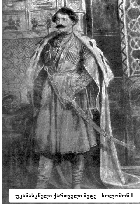
უკანასკნელი ქართველი მეფე - სოლომონ II

ასეთ სიტუაციაში დამლუპველი იყო ქართული სამე- ფო-სამთავროების დაქსაქსულობა და ურთიერთდაპირისპი- რება, რადგან რუსეთი ყოველ მათგანს სათითაოდ უღებდა ბოლოს. საჭირო იყო გა- ერთიანებული ძალებით დახვედროდნენ მოახ- ლოებულ საფრთხეს. სო- ლომონ II ცდილობდა რუსეთთან ურთიერთო- ბაში მთელი დასავლეთ საქართველოს სახელით გამოსულიყო... ქართუ- ლი სამთავროები შემო- ემტკიცებინა, სამეფო გაეძლირებინა, საზღვ- რები განემტკიცებინა. გურიის მთავარი კი აღი- არებდა მის უზენაესო- ბას, მაგრამ სამეგრელოს მთავარი დიდ წინააღ- მდეგობას უწევდა.