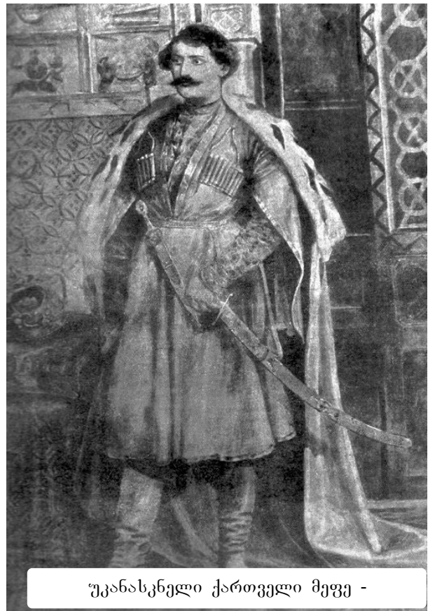
უკანასკნელი ქართველი მეფე -

XVIII-XIX სს. მიჯნაზე იმერეთი საქართველოს სამეფო-სამთავროთა შორის ყველაზე ძლიერ სახელმწიფოებრივ ერთეულს წარმოადგენდა [6, გვ. 41]. რუსეთის მიერ საქრთაშორისო ხელშეკრულების ვერაგულად დარღვევამ და ქართლ-კახეთის სამეფოს ანექსიამ იმერეთის მეფე სოლომონ II (1772-1815) აღაშფოთა. იგი დაჟინებით ცდილობდა მიეღწია ქართლ-კახეთის სამეფოს აღდგენისათვის, არაერთხელ მიმართა რუსეთის იმპერატორს იულონ ერეკლეს ძის (1760-1816) ქართლ-კახეთის მეფედ დამტკიცების შესახებ. მაგალითად, 1801 წლის ივლისში იმერეთის მეფის დესპანები სოლომონ ლიონიძე და როსტომ ნიჟარაძე აცნობებენ რუსებს, რომ სოლომონ II მზადაა შევიდეს რუსეთის მფარველობაში, მაგრამ იმ პირობით თუ ქართლ-კახეთის მეფედ იულონი იქნება დამტკიცებული. სოლომონ II კარგად ხედავდა, რომ კავკასიის ქედს გადმობიჯებული რუსეთი მიღწეულს არ დასჯერდებოდა, მან პლაცდარმი შეიქმნა მთელი ამიერკავკასიის დასაპყრობად.