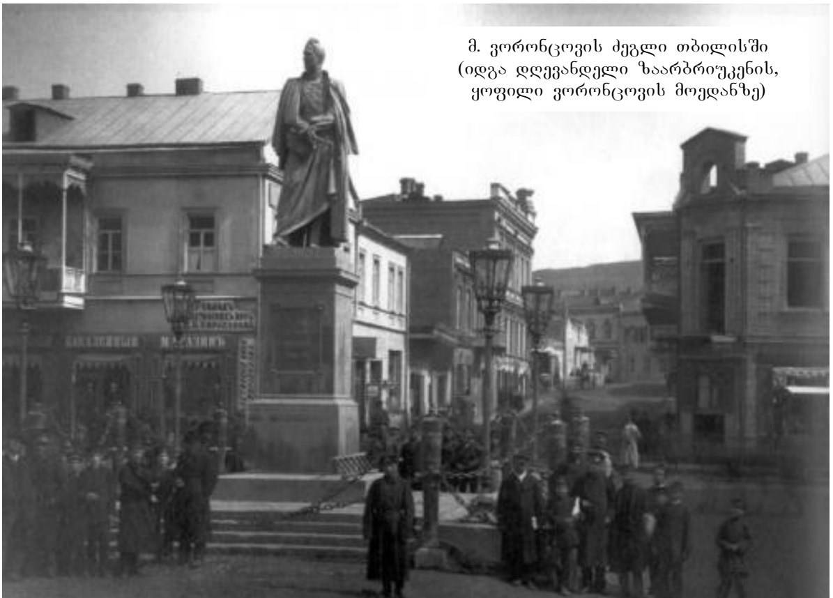
მ. ვორონცოვის ძველი თბილისში (იდგა დღევანდელი ზაარბრიუკენის, ყოფილი ვორონცოვის მოედანზე)

აღსანიშნავია ისიც, რომ ამ პერიოდში იწყება ფეოდალური საკუთრების თანდათან მოშლა, დაქირავებული შრომის შედარებით ფართოდ გამოყენება, სამრეწველო უჯრედების შექმნა, საქართველო თანდათან ებმება კაპიტალისტური განვითარების ორბიტაში. ერთი სიტყვით, დაიწყო ძველი სოციალ-ეკონომიკური ფორმაციის რღვევა. ვორონცოვმაც აღლო აუღო ვითარებას, იგი ესწრაფოდა დაჩქარებულიყო რუსეთის ერთიანი ეროვნული ბაზრის ორბიტაში საქართველოს ჩართვა, მის ნაწილად გადაქცევა. სწორედ ამას ისახავდა მიზნად, და არა საქართველოზე ზრუნვას, მის მიერ გატარებული ის ღონისძიებები, რომლებიც სავაჭრო გზების გაყვანით, რუსი კაპიტალისტების მოწვევით, სოფლის