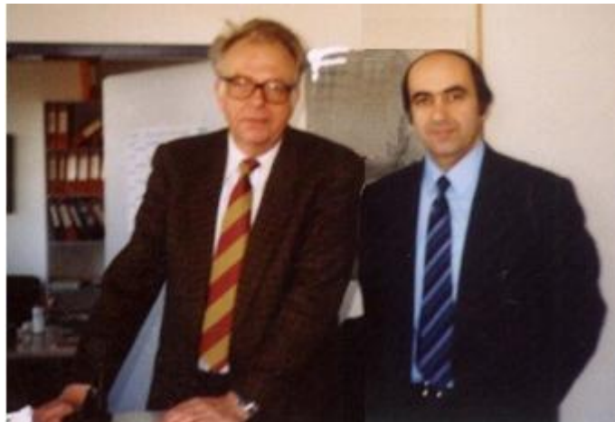
3. ვედეკინდი, გ. სურგულაძე (1995 წ. ერლანგენი)

აღსანიშნავია, რომ მონაცემთა რელაციური ბაზების კლასიკურ თეორიაში არსებობდა მხოლოდ სამი ნფ. აგრეთვე ცნობილია ე.წ. „ვონგ-ვედეკინდის“ ალგორითმი სამი ნფ-ის საფუძველზე მონაცემთა ბაზის ოპტიმალური სქემის შესარჩევად. გ. სურგულაძის მიერ, შემუშავებულ იქნა ახალი განზოგადებული ალგორითმი n-არული სქემებისათვის („ვედეკინდ-სურგულაძის“ ალგორითმი: „О выборе приемлемых нормальных форм логической схемы реляционных БД, 1983), რომლის შემდგომი ადაპტირება განაწილებული სისტემების მონაცემთა ბაზების დასაპროექტებლად გერმანელი პროფესორის ჰარტმუტ ვედეკინდისა (ნიურნბერგ-ერლანგენის უნივერსიტეტის „მონაცემთა ბაზების სისტემების“ კათედრის გამგე) და გ. სურგულაძის მიერ უკვე ერთობლივად წარიმართა გერმანიაში (1995-2000 წლებში, სურ.1). პირველი შედეგები გამოქვეყნდა სტუ-ს „მას“-კათედრის 25 წლისთავისადმი მიძღვნილ საერთაშორისო კონფერენციაზე (1996): „განაწილებული სისტემების დაპროექტების ტექნოლოგია ობიექტ-ორიენტირებული მეთოდების საფუძველზე“. მოგვიანებით კი - მონოგრაფიაში „განაწილებული ოფის-სისტემების მონაცემთა ბაზების დაპროექტება და რეალიზაცია UML-ტექნოლოგიით“ (2006, თანაავტორები ვ. ვედეკინდი, ნ. თოფურია).