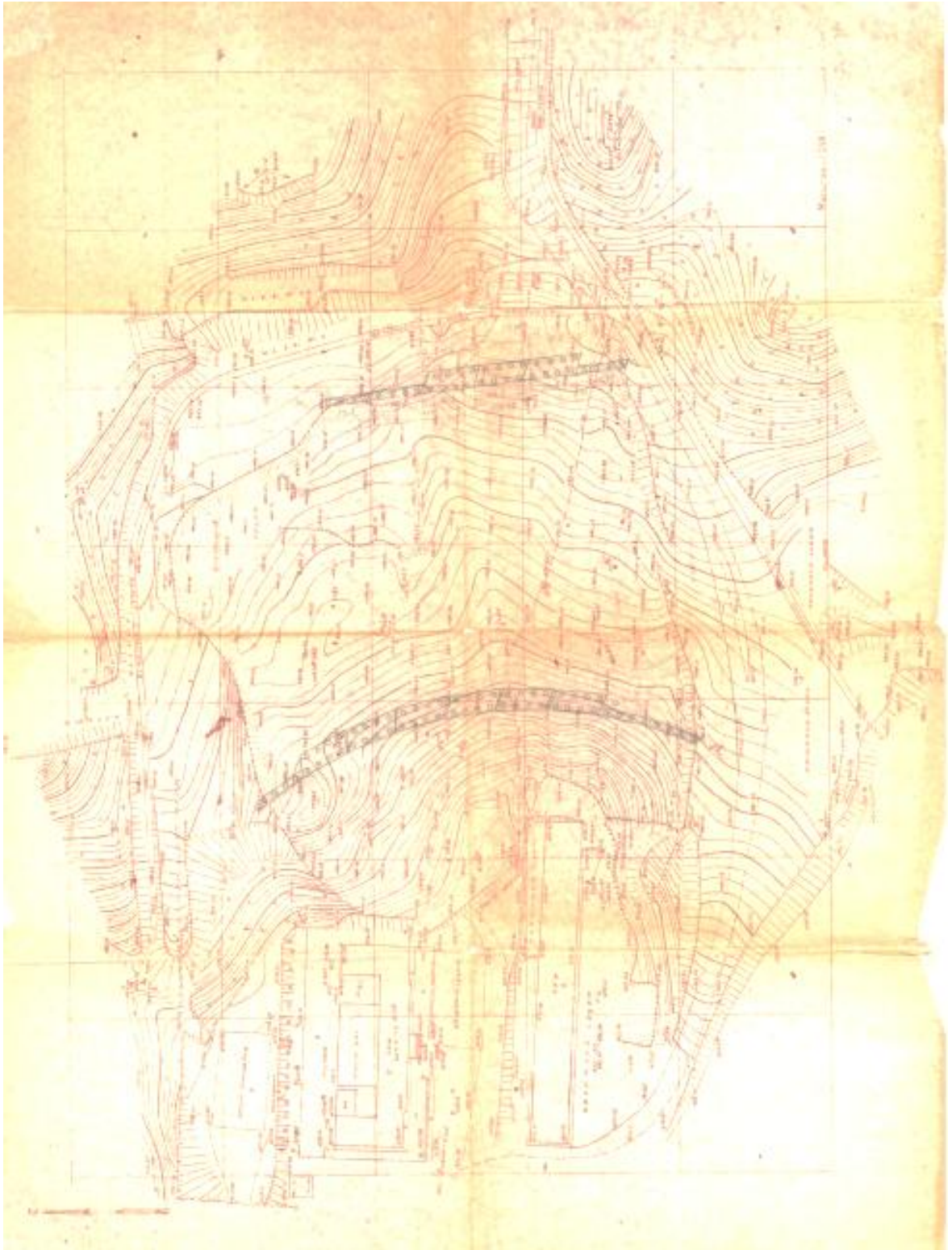
სურ. 2.1. ნაბურღ-ნატენი ხიმინჯების განთავსება