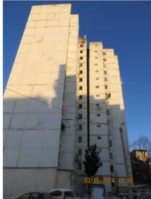
სურ. 2 მიჯრით განლაგებული 13 სართულიანი საცხოვრებელი სახლების საერთო ხედი