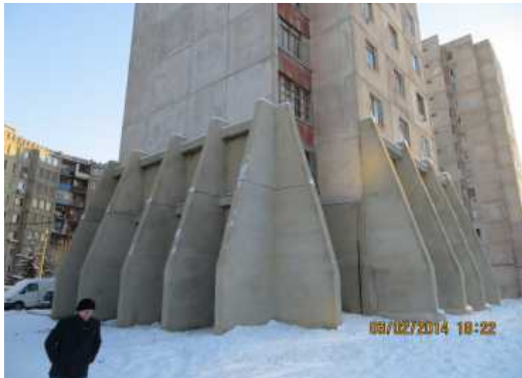
სურ. 5 საცხოვრებელი სახლის ძირა ორი სართულის ხედი საძირკვლების გაძლიერების შემდეგ.

სახარჯთაღრიცხვო დოკუმენტაციის მიხედვით კორპუსზე 430 სარეკონსტრუქციო სამუშაოთა მთლიანმა ღირებულებამ შეადგინა 461.69 ათასი ლარი, რომლის მიხედვითაც ქალაქის ბიუჯეტიდან გამოიყო თანხა და კაპიტალური რემონტის შედეგად მერიის დაფინანსებით გამაგრდა საცხოვრებელი სახლი. მზიდი კონსტრუქციების გაძლიერებით, სამუშაოთა ჩამონათვალი იხილეთ ცხრილში 1, მისი მტლიანი ფართობი 6462 მ 2 -ის რასაც აღნიშნულიდან გამომდინარე საცხოვრებელი სახლის სარემონტო-სარეკონსტრუქციო სამუშაოთა ღირებულებამ ერთ კვადრატულ მეტრ ფართობზე გადაყვანით შეადგინა 461690/6462=71,4 ლარი.