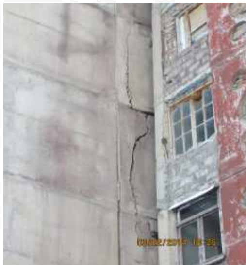
სურ. 4 იგივე საცხოვრებელი სახლის გვერდითი ხედი კედლის პანელებზე გამჭოლი ბზარებია.