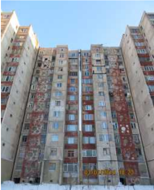
სურ. 1 საცხოვრებელი კომპლექსის ხედი ეზოს მხრიდან

სურათებზე 1,2,3,4 აღბეჭდილია ვარკეთილში IIIა მ/რაიონში 427,428,429 და 430 კორპუსებში არქიტექტორ კვიციანიძის სახელით ცნობილი 13 სართულიანი კარსაკულ-პანელოვანი საცხოვრებელი კორპუსები ერთმანეთზე მიდგმული ნაადრევი მოძველებისა და ფიზიკური ცვეთისაგან გამაგრება-გაძლიერების შემდეგ.