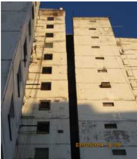
სურ. 3 საცხოვრებელი სახლის გადახრა მთლიან სიმაღლეზე, მიმდებარე სახლებთან შედარებით თვალსაჩინოა.